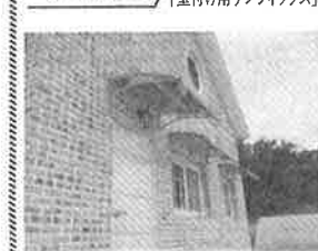
▲勝手口その他、窓の上にも設置できる